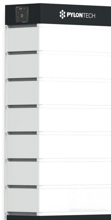
Pila di Batterie